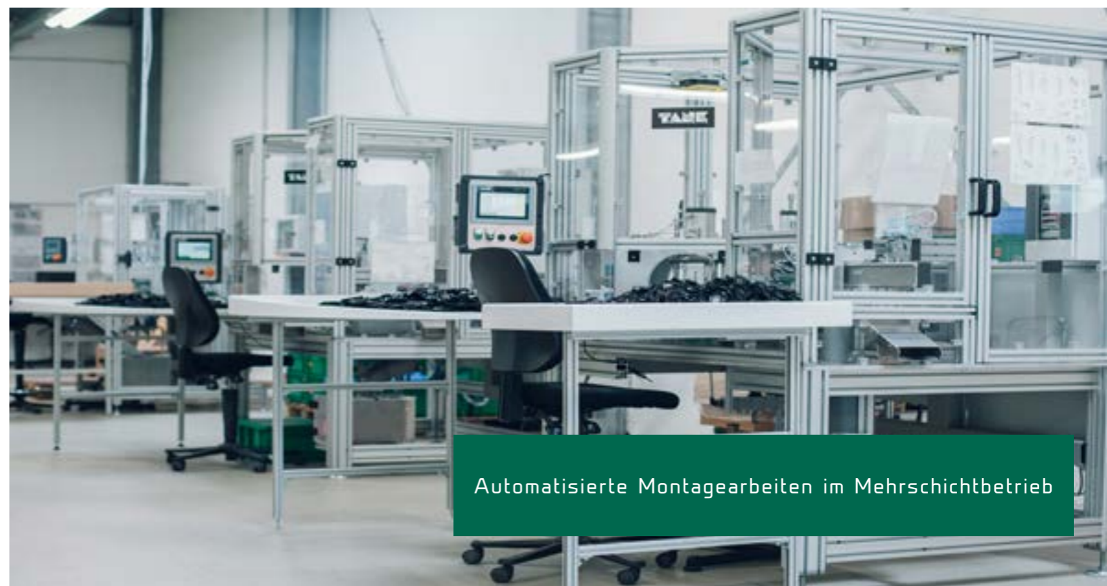
Automatisierte Montagearbeiten im Mehrschichtbetrieb

DURCH UNSERE KUNDEN IN DER AUTOMOBILINDUSTRIE FINDEN BEMUSTERUNGEN UND QUALITÄTSSICHERUNGSMASSNAHMEN NACH NORMGERECHTEN UND STANDARDISIERTEN VERFAHREN AUF HÖCHSTEM INDUSTRIENIVEAU STATT.